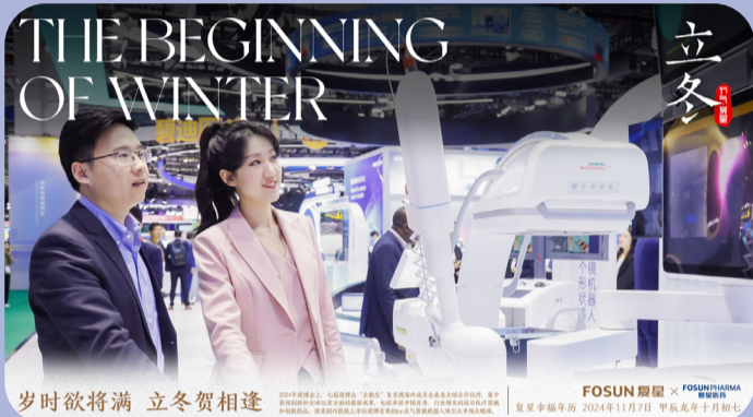
岁时欲将满 立冬贺相逢

2024 年进博会上，七届进博会“全勤生”复星携海外成员企业及全球合作伙伴，集中展现创新和全球运营方面的最新成果，包括多款中国首秀、行业领先的前沿医疗器械和创新药品。迎来国内获批上市后进博首秀的 Ion 支气管镜机器人吸引众多观众眼球。