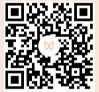
本文内容综合自人民网健康、新华社 扫码看视频

黄浦江畔，金秋的外滩暖意融融。两位村医还打卡了复星总部和“会跳舞的房子”复星艺术中心，体验国际化的企业文化和充满活力的当代艺术。特别一提的是，此次接送村医的工作由复星员工公益（WE Volunteer 星益家）组织安排，让远道而来的朋友在上海也能感受到回家的温暖。