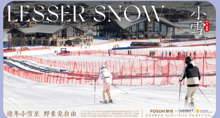
迎冬小雪至 野素竞自由

11月18日，Club Med 长白山度假村以极具民族风情的开村仪式，正式开启 2025 雪季。Club Med 全球运营 23 家冰雪度假村，遍布中国、北海道与欧洲，从专业分级雪道到壮丽高山滑雪，为你开启自由自在的冰雪假期。