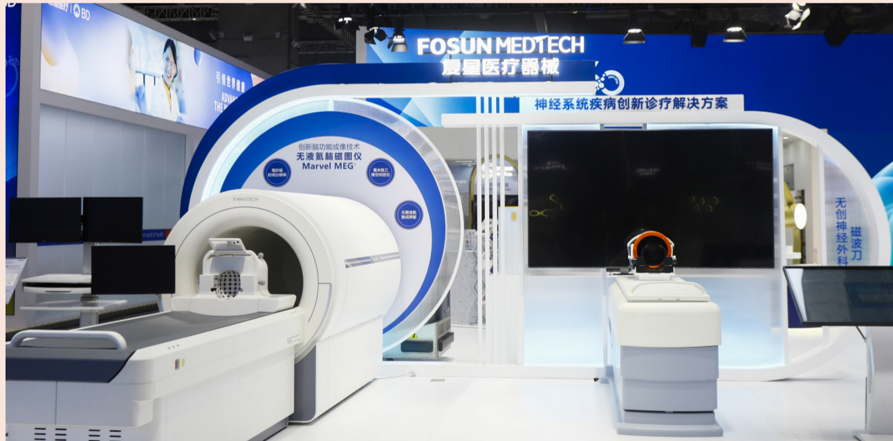
CNS（脑神经修复术）创新治疗技术“磁波刀”全新V2机型迎来中国首展

在本次进博会上，CNS（脑神经修复术）创新治疗技术“磁波刀”全新V2机型迎来中国首展，备受行业期待。这一全新机型已获得欧洲CE认证和美国FDA批准，并于2024年递交国家药监局注册申请。V2机型的创新之处在于，不仅为临床治疗药物难治性特发性震颤和以震颤为主型的帕金森病提供无创手术方案，同时还可适配更多品牌型号磁共振机型，进一步扩大该技术的可及性。