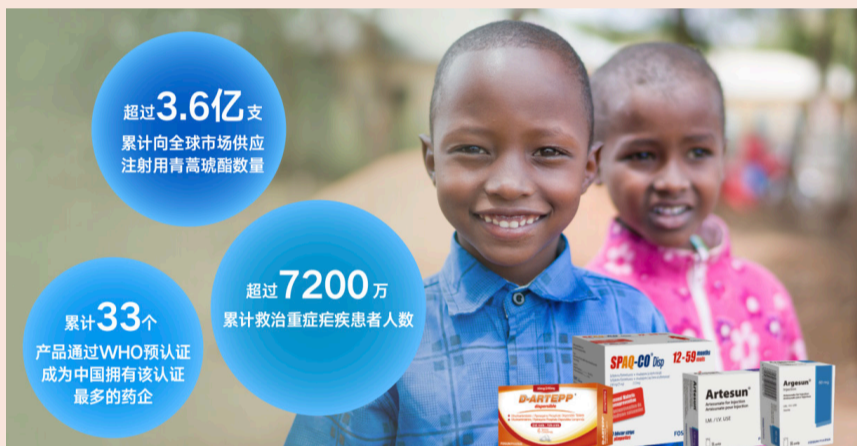
复星医药将自主研发的青蒿素类创新产品带到非洲，为全球抗疟疾事业提供中国的创新解决方案